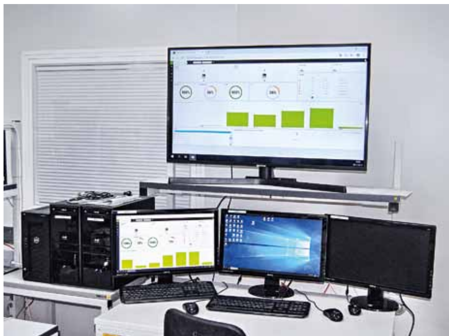
Мониторы системы «Умная линия»

Современное оборудование поставляется с программным обеспечением (ПО), которое, как правило, позволяет собирать и обрабатывать определенную информацию о техпроцессе. Этого ПО недостаточно