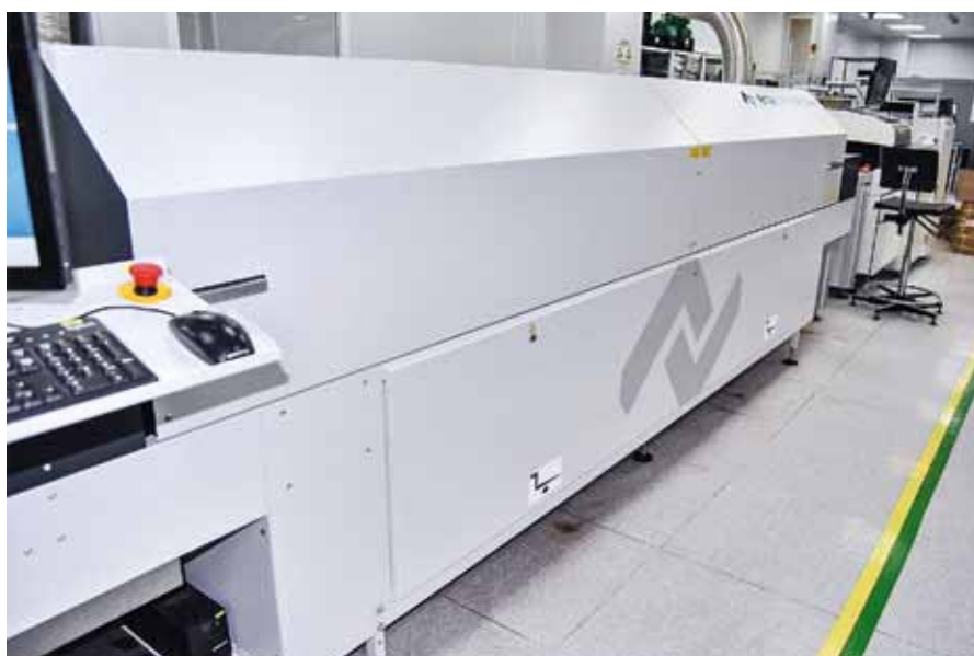
Печь пайки оплавлением Ersa Hotflow 3/14e с семью зонами нагрева и двумя – охлаждения

Рынок огромный. Большим потенциалом обладают и региональный, и всероссийский, и зарубежные рынки: