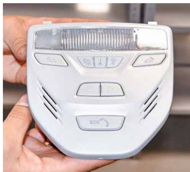
Готовый блок для салона автомобиля с системой экстренного вызова «ЭРА-ГЛОНАСС»