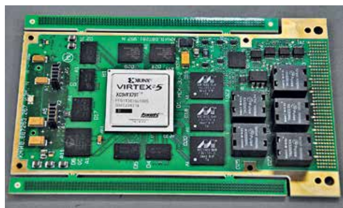
4 На новой линии автоматического монтажа собираются платы высокого уровня сложности

Как правило, печатные платы нашего производства — это наш основной бизнес. Мы предлагаем хорошие цены и высокое качество, и большинство заказчиков соглашается поручить их изготовление нам. Мы предлагаем все