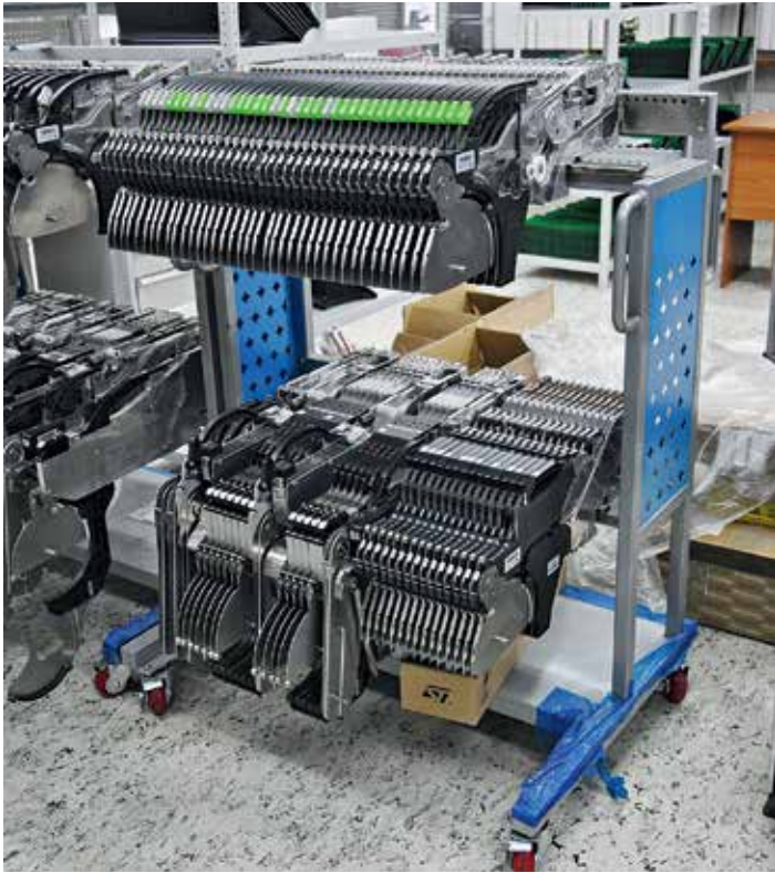
2 Ленточные питатели на тележке для хранения