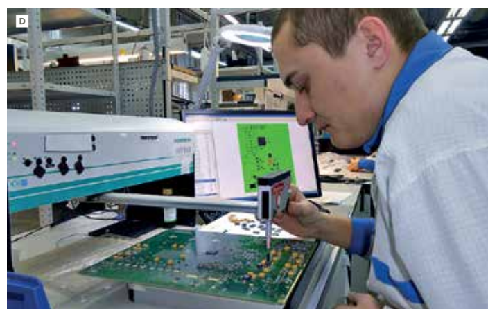
3 Рабочее место ручного монтажа и визуального контроля/ремонта A ; установка формовки выводов типа «крыло чайки» B ; манипулятор C ; рабочее место для восстановления шариков BGA-компонентов и снятия/установки BGA D

на этом зарабатывают. Когда же клиент соглашается работать с нашим отделом комплектации, то мало того, что исключаются перечисленные выше проблемы; мы закупаем компоненты с учетом технического запаса, в частности, для зарядки питателей. В результате и работа идет гораздо быстрее, и качество гарантируется на более высоком уровне.