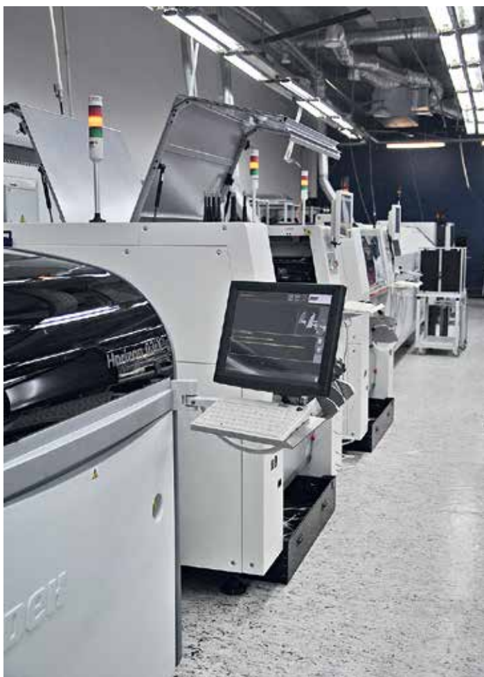
1 Автоматическая линия поверхностного монтажа в цехе компании «ПСБ технологии»