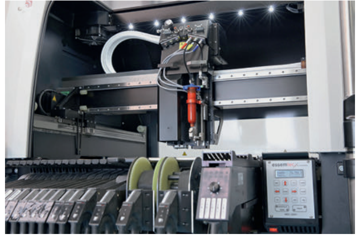
Универсальный сборочный центр Essemtec Fox: сочетание блочных и отдельных питателей уменьшает ТСО

Для дозирования применяются пасты, отличные от тех, которые предназначены для трафаретной печати. Но это не значит, что для дозаторов Essemtec нужны