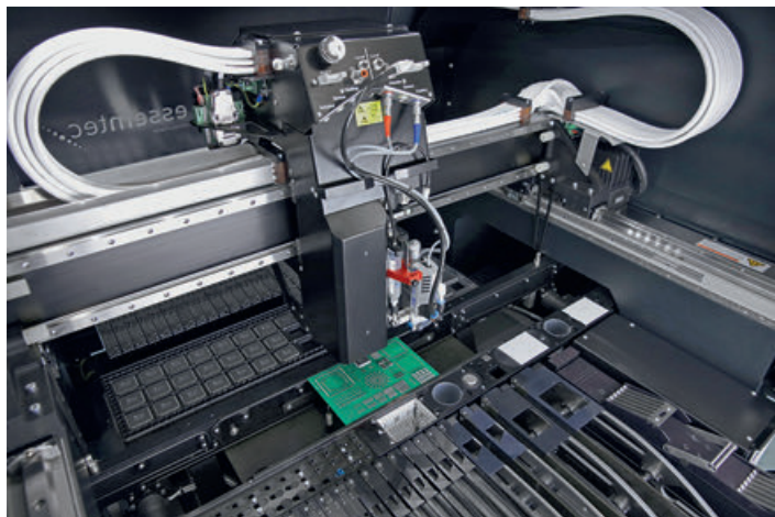
Универсальный сборочный центр Essentec Fox: нанесение пасты в одном цикле с установкой

право на ошибку. Пусть он ошибается один раз на тысячу паяк, что очень неплохой результат, но если на плате три-четыре тысячи точек пайки, то у вас будет три-четыре ошибки, возможно, на единственном экземпляре очень дорогой платы, к которой могут предъявляться крайне высокие требования по качеству и надежности. Выявить такие ошибки очень сложно: системы АОИ плохо работают с ручной пайкой, а проверка контролером сложных уникальных плат тоже трудозатратная и не лишенная влияния человеческого фактора задача.